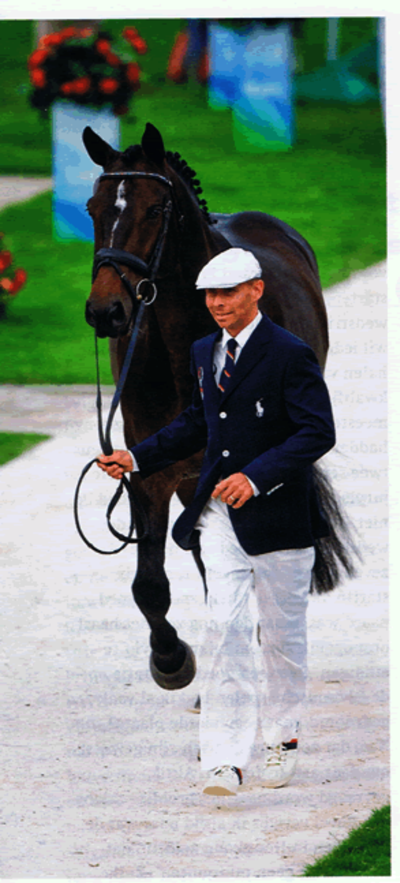
De jury was het erover eens in Hongkong: Ravel heeft geen minpunten, zo'n paard kom je maar zelden tegen.

heb gefokt is echt puur toeval', begint de fokker zijn verhaal. 'Ik fok al heel lang paarden, maar de merriestam die ik gebruikte was niet bijzonder vruchtbaar. Ik heb toen verschillende paarden weggedaan en later kwam de Democraatmerrie Hautain op mijn pad. Ik kocht haar samen met nog een merrie, beide drachtig van Ekstein. Hautain heb ik gehouden en de andere merrie heb ik al weer snel verkocht. De keuze voor Hautain is puur geluk geweest, een andere verklaring heb ik